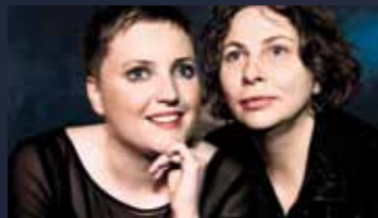
▲ MÉNAGE À TROIS

Lassen Sie sich vom südländischen Flair verzaubern und erleben Sie