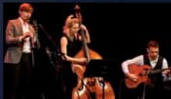
▲ MONACO SWING TRIO