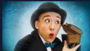
▲ MONSIEUR MOMO

Freuen Sie sich auf das Trio Nimmersatt, das im stilvollen Anblick des Jugendstil-Bades mit „Lass mich dein Badewasser schlürfen“ eine unterhaltsame Mischung aus Musik der